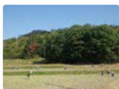
「源五郎稲作の里山」

・「地域の生物多様性のこだわり巡り」8:30~12:00(世羅町内、尾道市の農村集落)