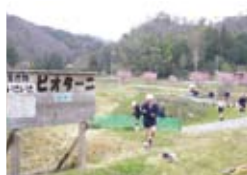
「ピオターニ」(小谷地区)