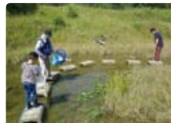
「こっこつピオトーチ」(田打地区)