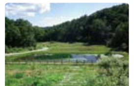
「せら夢公園 自然観察園」