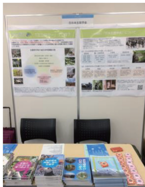
ノベルティが並んだ生態学会のブース