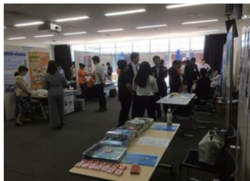
ブース出展会場の様子

ブース出展では、生態学と生態学に関連した学位取得者の職業紹介や実際に活躍している女性研究者などを紹介するポスターを展示し、学会が作成した配布用ノベルティ（巻尺、クリアファイル）および「エコロジー講座」を150冊（No.2～6）の配布を行った。巻尺は、生態学者の日頃の活動について具体的なイメージを喚起しやすいらしく、学会員の説明によって参加者が納得するというシーンも見られた。 特に人気だったのはエコロジー講座のバックナンバーで、ブース展示時間の途中で品切れとなり、欲しい方全員に配布できなかったことが残念だった。 また、エコロジー講座のNo.2～6の中で最も人気が高かったのはNo.2「生きもの数の不思議を解き明かす」というタイトルのもので、 手に取った参加者にその理由を尋ねたところ「不思議というタイトルに興味がある」との返答を得た。 全体的に、環境問題の解決や生物保全よりも、「自然現象の疑問について知りたい」という理学的興味を持つ参加者が多かったように感じられ、潜在的な理系好きの学生とコンタクトできる点で本イベントに参加する価値はかなり高いと思われた。また、生態学について知らない参加者が多く、生態学の認知度向上に貢献できた。 エコロジー講座は非常に人気かつ有用で、参加者に生態学の面白さを伝える重要なツールとなる と考えられる。予算の獲得や執筆・編集に携わる方々のご苦勞は並大抵のものではないと拝察されるが、今後もし是非、継続して出版していただけるようお願い申し上げます。